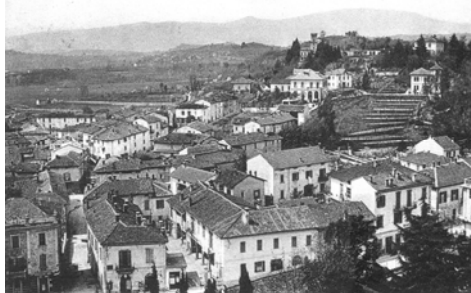
Paesaggio di GAVIRATE - Frazione Fignano

Papa Francesco raggiungerà il Duomo, con arrivo previsto alle 10, dove sarà accolto dai vescovi ausiliari e dall'arciprete. In Cattedrale si recherà nello scurolo di San Carlo, una piccola ma preziosa cappella ottagonale, realizzata nel 1606 da Francesco Maria Richini, in cui riposa il corpo di San Carlo Borromeo racchiuso in una bara di cristallo e d'argento. Qui il pontefice si soffermerà per l'adorazione del Santissimo Sacramento e la venerazione delle reliquie di San Carlo, riceverà il saluto del Cardinale Scola e risponderà alle domande dei sacerdoti. Alle 11 saluterà i fedeli radunati in Piazza Duomo, reciterà l'Angelus e li benedirà sulla piazza.